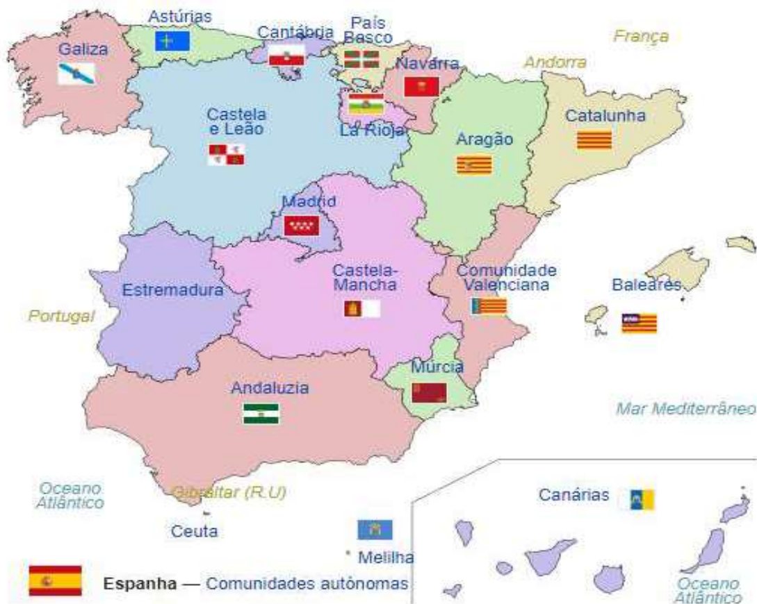
Figura 1 - Mapa de Espanha