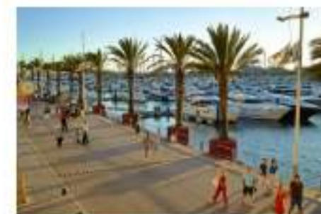
Marina de Vilamoura

Pela sexta vez, Vilamoura foi distinguida como Melhor Marina Internacional no Southampton International Boat Show 2022. Para além da vertente náutica, Vilamoura tem apostado na promoção do turismo acessível e foi um dos finalistas do PNT – Prémio Nacional de Turismo, na categoria de Turismo Inclusivo.